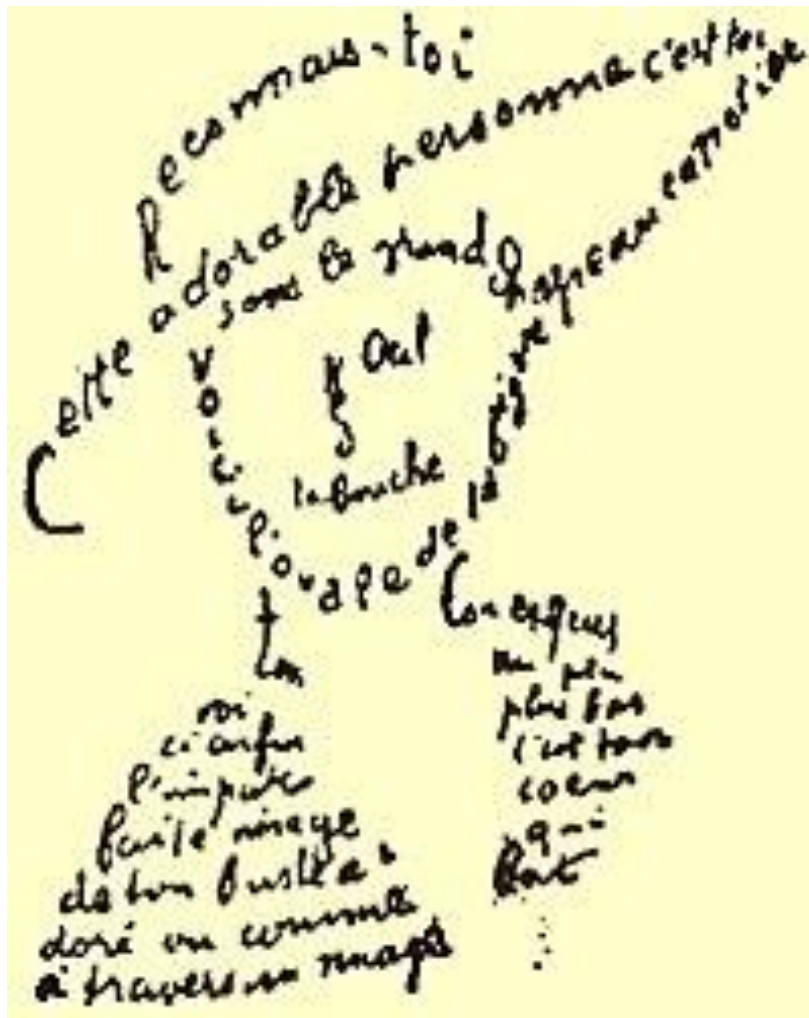
Calligramme de Guillaume Apollinaire

Reconnais-toi Cette adorable personne c'est toi Sous le grand chapeau canotier Œil Nez La bouche Voici l'ovale de ta figure Ton cou exquis Voici enfin l'imparfaite image de ton buste adoré Vu comme à travers un nuage Un peu plus bas, c'est ton cœur qui bat.